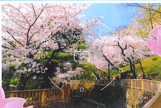
石神井川の桜並木